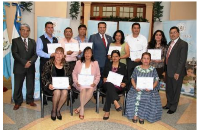
Recepción en MINEDUC