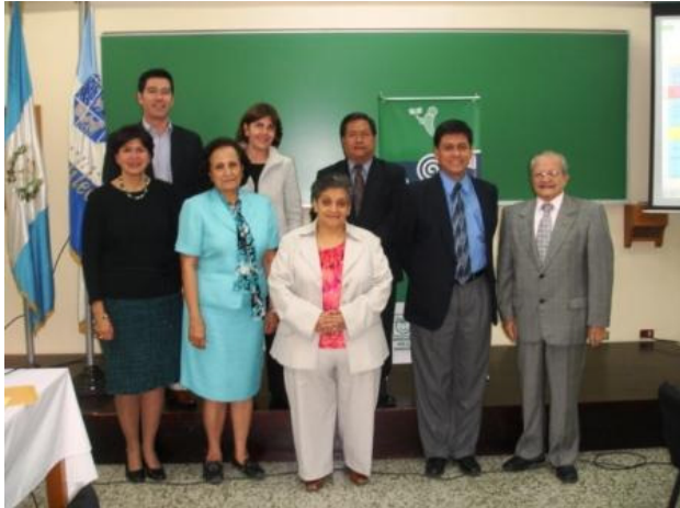
Integrantes del Jurado Calificador Final