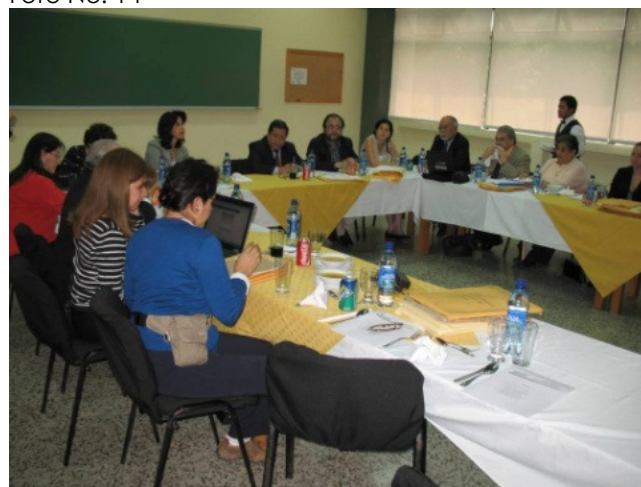
Miembros del Primer Jurado Calificador