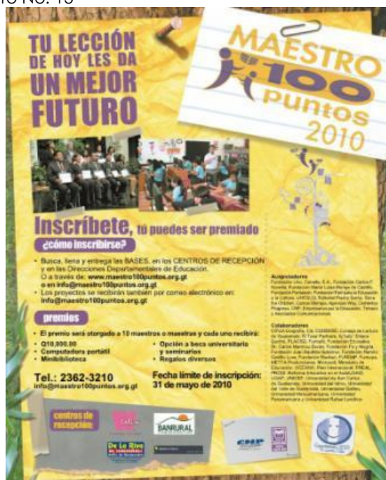
Diseño en medios escritos de la campaña del Premio