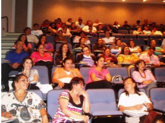
Taller de Emprendimiento