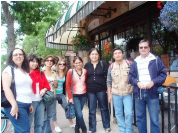
Maestros becados en Estados Unidos