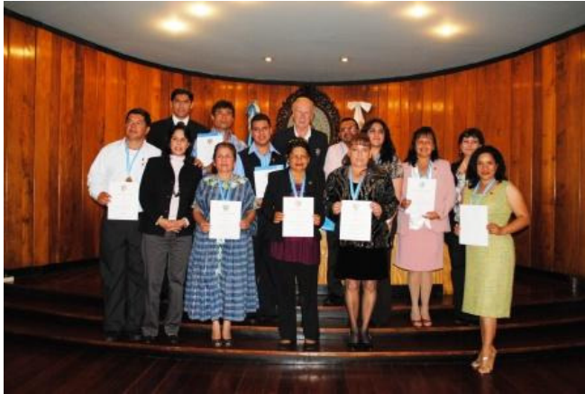
Homenaje en la Municipalidad capitalina