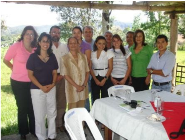
Conformación del Capítulo de Cobán

En los Capítulos de Sacatepéquez y Quetzaltenango se sostuvieron reuniones con sus juntas directivas con el objetivo de fortalecer el trabajo que están realizando.