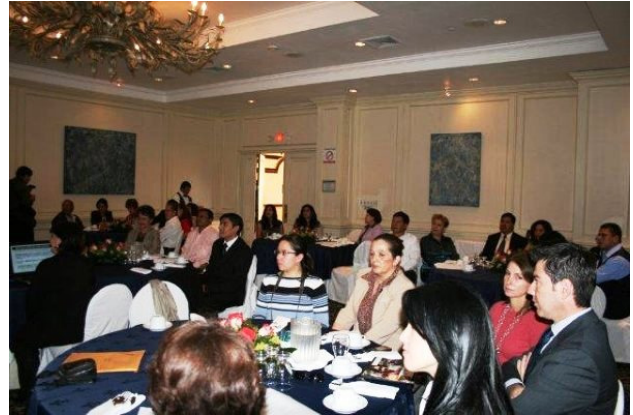
Actividad de Bienvenida