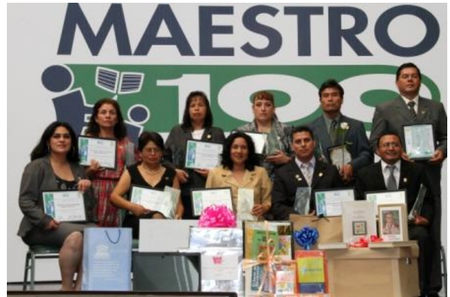
Maestros 100 Puntos 2010