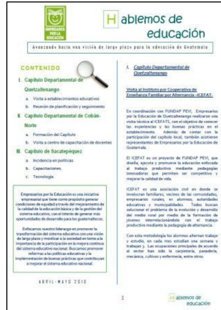
Boletines enviados a asociados