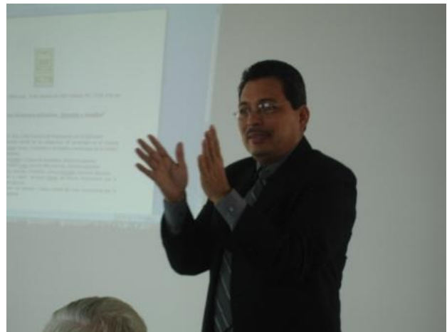
Viceministro de Educación