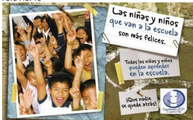
Diseño en medios escritos de la campaña

Asimismo, se utilizaron como canales efectivos de comunicación las páginas de Internet tanto de Empresarios por la Educación, ( www.empresariosporlaeducacion.org ), como del Premio Maestro 100 Puntos ( www.maestro100puntos.org.gt ). Las redes sociales fueron parte importante en este eje, como lo son Facebook, Twitter y Youtube.